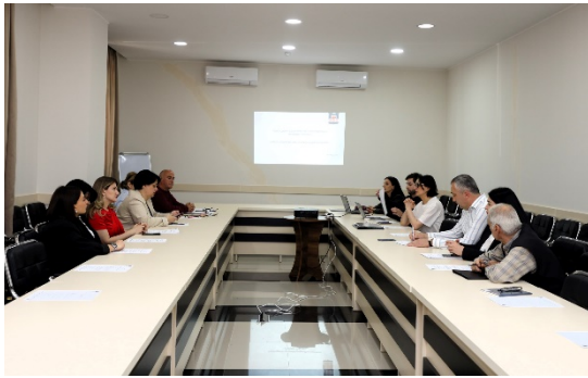
ინტერმუნციპალური პლატფორმის დაფუძნება გურიის რეგიონში