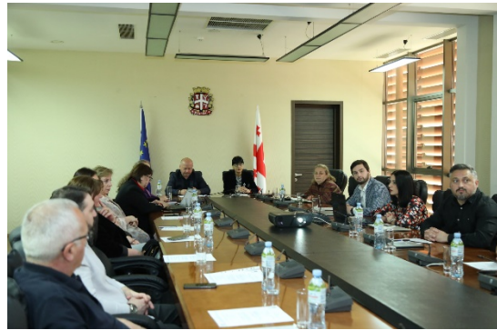
ინტერმუნციპალური პლატფორმის დაფუძნება მცხეთა- მთიანეთის რეგიონში